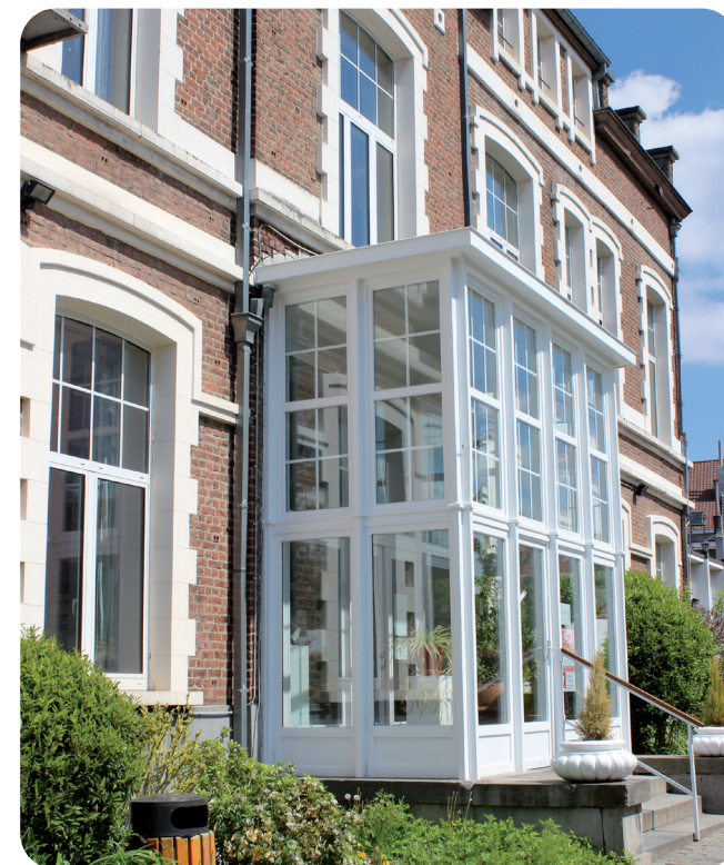
Service de jour Centre psycho-socio-thérapeutique de jour